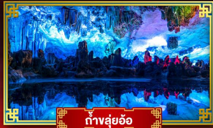
ถ้ำสุ่ยอ้อ

"ดินแดนแห่งสายน้ำและขุนเขา" สัมผัสประสบการณ์นั่งบอลลูนชมวิวมุมสูง