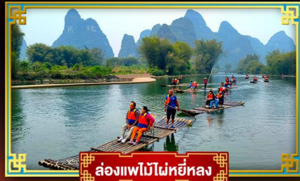
ล่องแพไม้ไผ่หยี่หลง