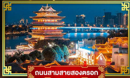
ถนนสามสายสองครอก